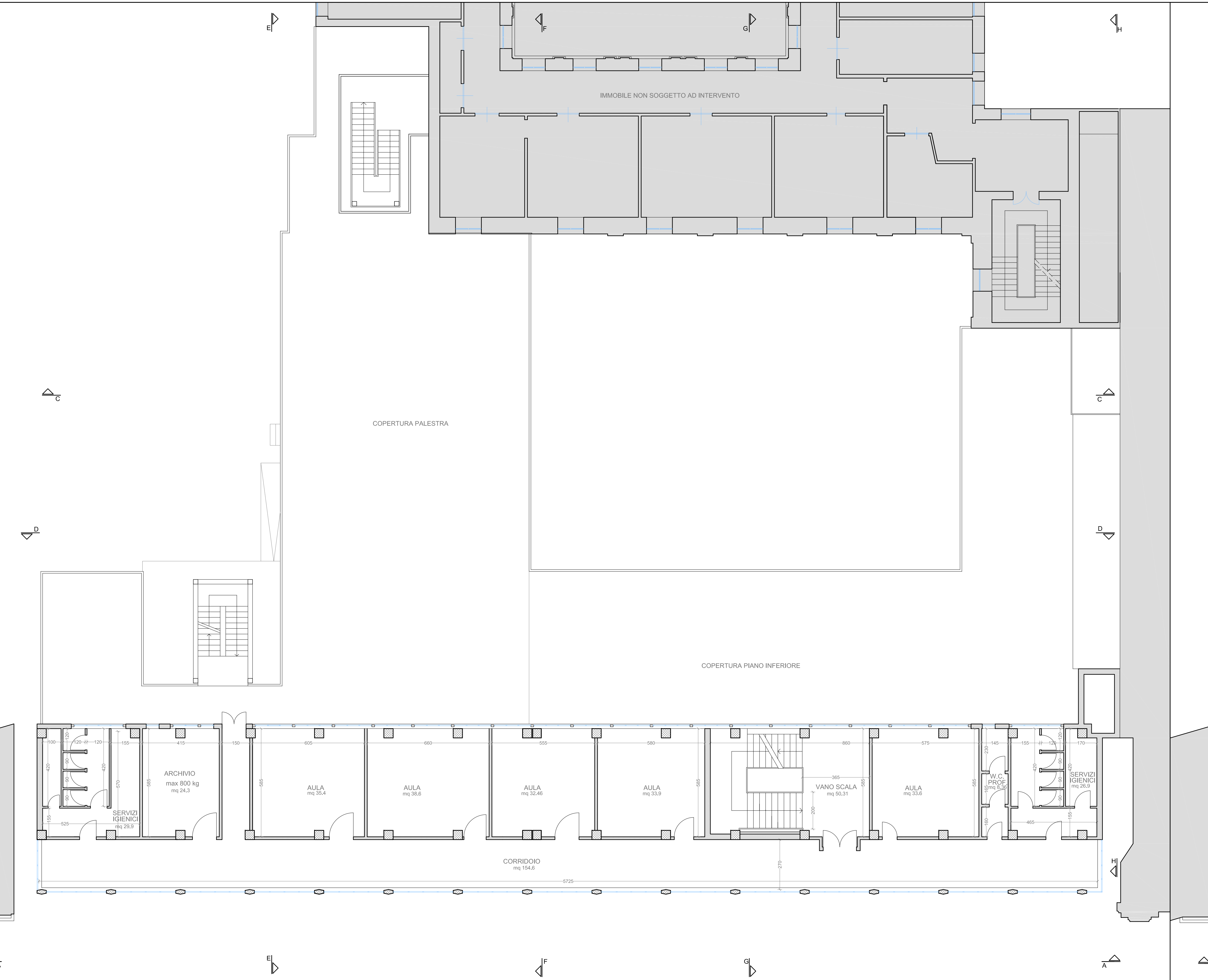
PIANTA PIANO SECONDO 1:100

I Progettisti: Arch. Gaetano Manganoello Arch. Carmelo Tumino I collaboratori: - Progetto architettonico: arch. Simona Tumino, arch. Federico La Ferla - Progetto strutturale: ing. Giorgio Longanti, ing. Gianluca Biondo - Progetto impiantistico: ing. Giuseppe Frullo - Indagini geologiche: geologo dell'Assessorato Pubblica - Indagini sismiche: befornieri ing. Gaetano Roda - Rende: Marco D'Amico, Vincenzo Bui - Computo metrico: geom. Fernando Cutuli